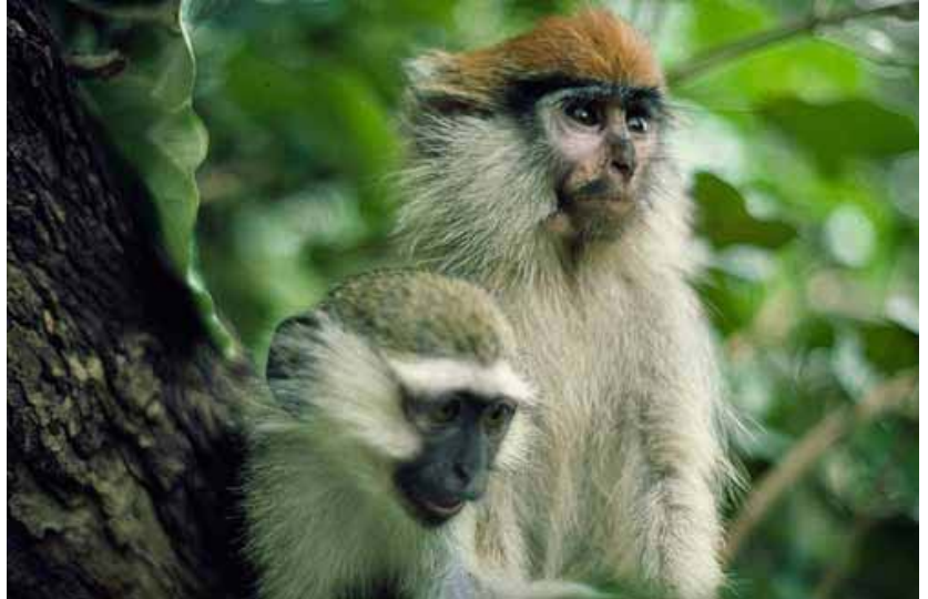
De voor vaccins gebruikte groene aapjes